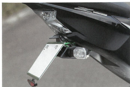
↑アルミピロットフェンダーレスキット (2万8600円)。写真のグリーンアルマイトは初期ロットのみの限定品です。現在ではブラックのみが販売されている。