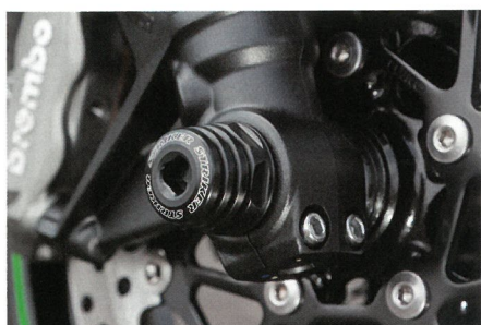
↑アクスルスライダー フロント(1万2100円)は、本体はジュラコン樹脂、ベース部をアルミとして強度を確保。純正アクスルシャフトにボルトオンで取り付けできる。