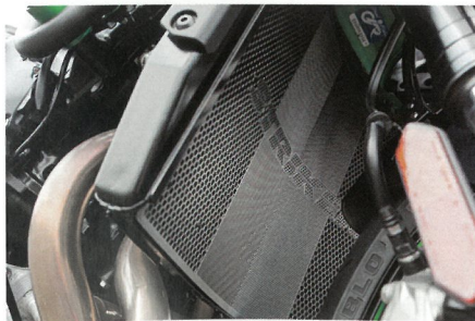
↑ラジエターコアガード (3万8500円)は、軽量かつ十分な剛性を持つステンレス製。ハニカム構造を基本として中央部のみ目の細かい格子状として機能性を高めた。