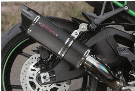
↑"INTER MODEL" RC SLIP-ON OFF-Type B レーシングマフラー(12万6500円〜)。こちらは競技専用で車検未対応。現在、車検対応マフラーを開発中なので期待しよう。