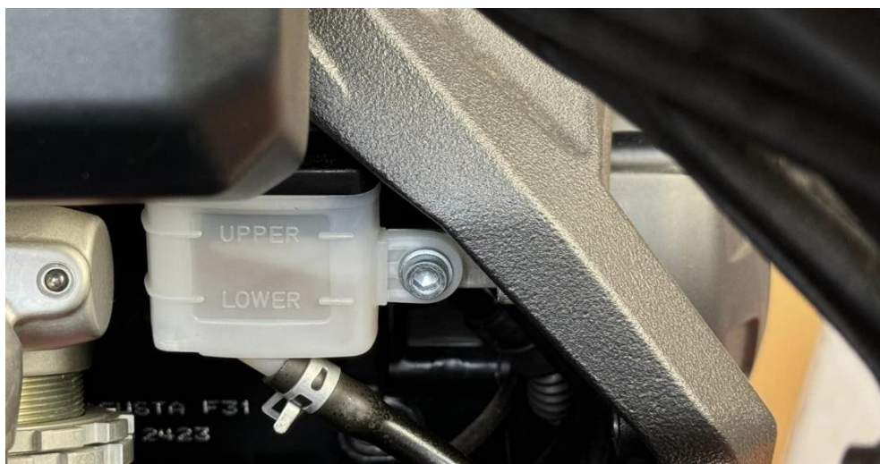
画像②:リザーバータンク移設位置 NO.13を使用し取り付け